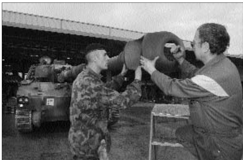
Die WEMA ist ernst zu nehmen. Schliesslich wird das vorhandene Material knapper und die nächst fassende Truppe wünscht möglichst einsatzbereites Material.