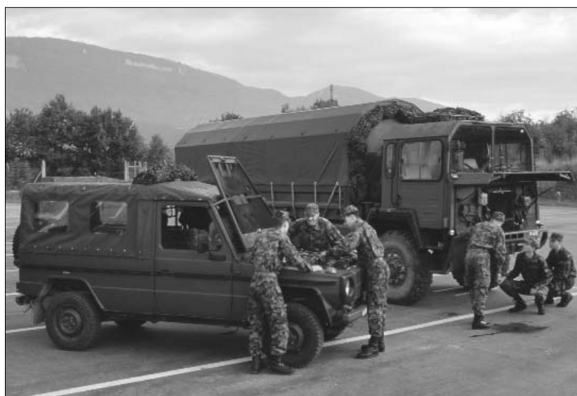
Für das Führen eines Puchs benötigt man den militärischen B-Test und die Kategorie 920. Damit darf man leichte geländegängige Motorwagen bis 3.5 Tonnen führen. Für den schweren Motorwagen benötigt man den militärischen A-Test und Kategorie 930 und erhält im zivilen Ausweis die Kategorie C.

Die vor dem 1.1.2004 ausgebildeten militärischen Fahrzeugführerinnen und Fahrzeugführer behalten ihren roten Ausweis. Das Dokument bleibt weiterhin unbeschränkt gültig. In folgenden Fällen können die militä-